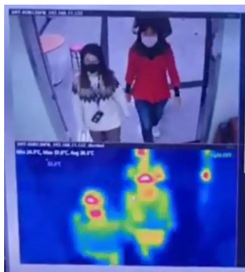
SI-體溫快篩系統產品說明示意(僅供參考)